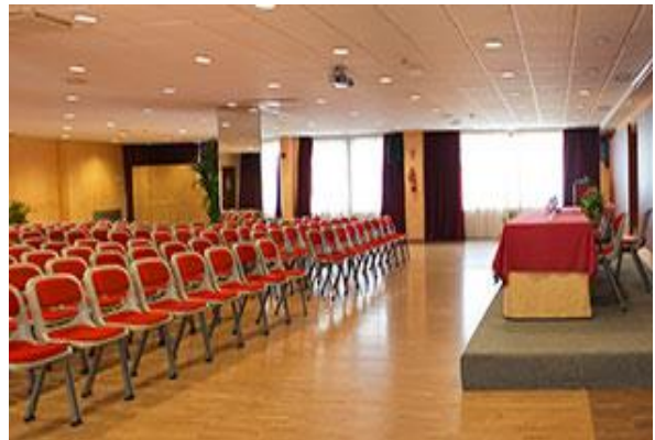
La salle de réunion principale