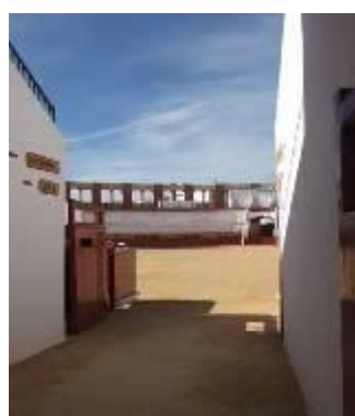
Arènes de Vinaros (15km)