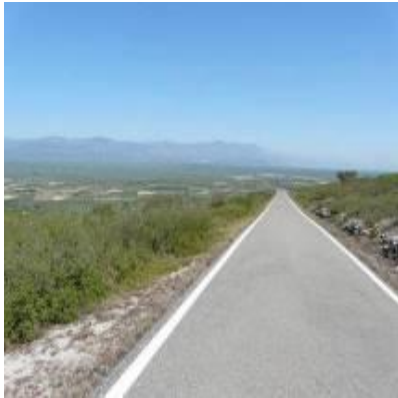
Sur la route des orangers