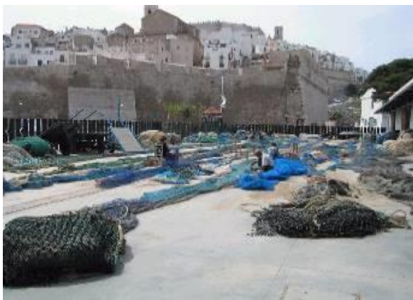
Le port de pêche