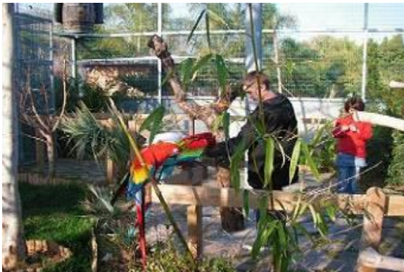
Le Parc animalier et oiseaux (2 km)