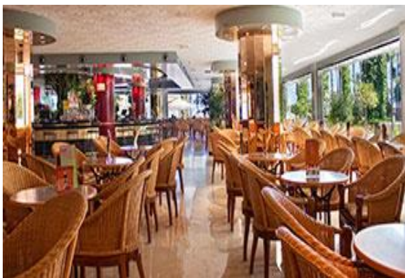
Le bar et la salle de télévision