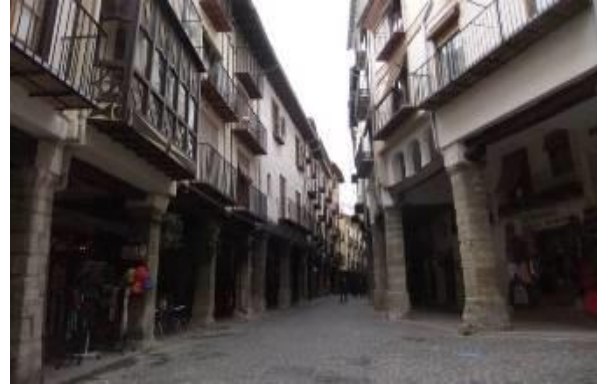
La grande rue de Morella avec ses trottoirs couverts