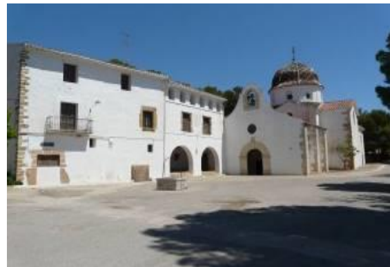
Nombreux hermitages, chapelles, ruines