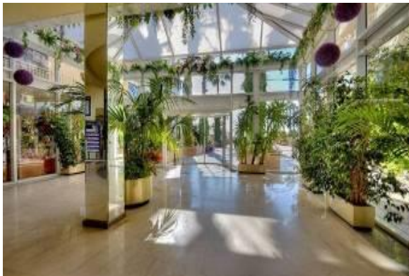
Le Hall d'entrée