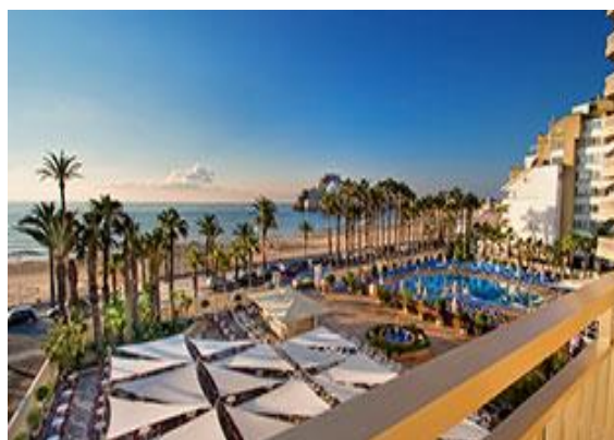
La piscine et le bar extérieur