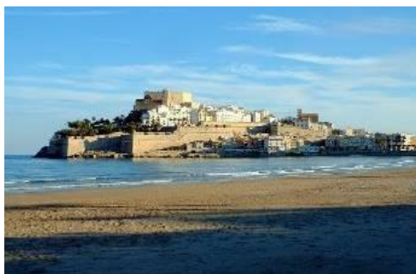
La citadelle vue de l'hôtel et sa plage

Séjour convenant parfaitement pour une fin de saison dans le calme et la convivialité.