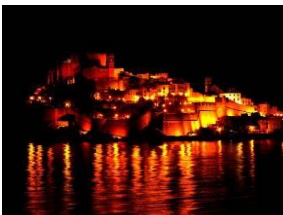
Péniscola la nuit