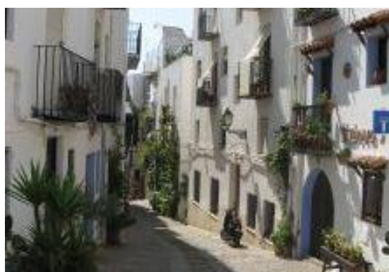
Les ruelles du village