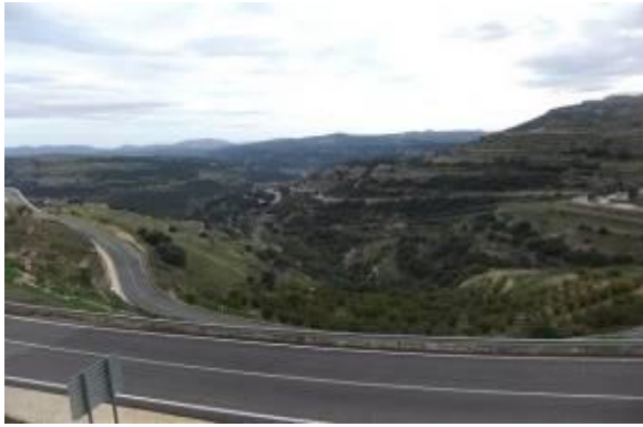
Col d'Ares 1134m