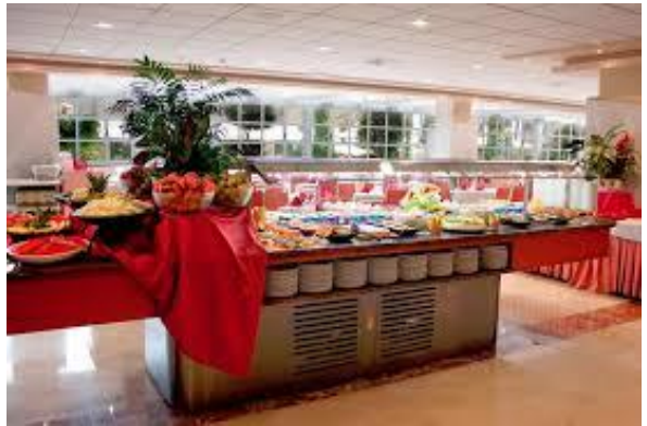
Vaste choix de plats, grill. Soirée à thèmes.