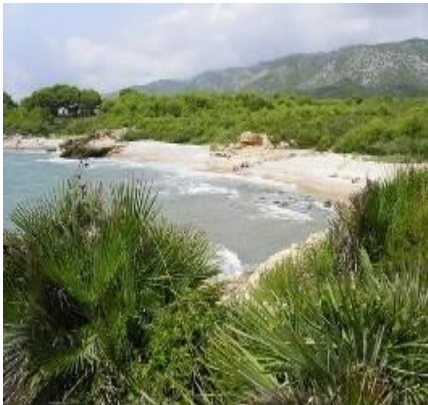
La Serra d'Irta

Le Château de Peniscola ( à 500m), La réserve naturelle ( à 300m), La Serra D'Irta (1km), les chemins de saint Jacques de Compostelle.