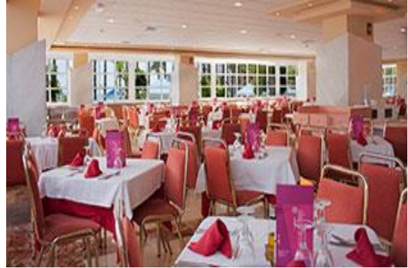
Une des 2 salles de restauration