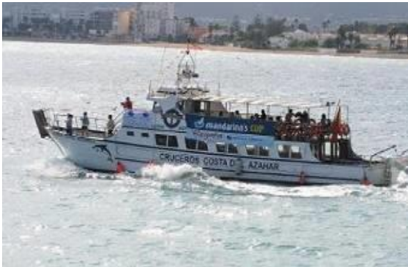
Promenade en mer