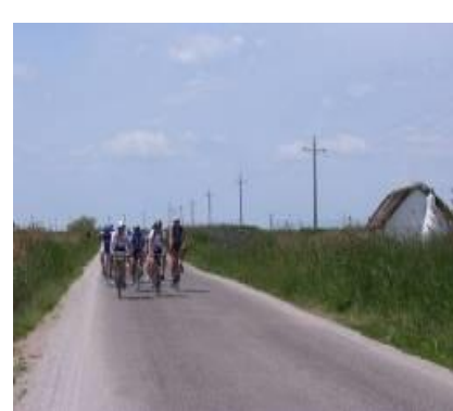
Delta de l'Ebre