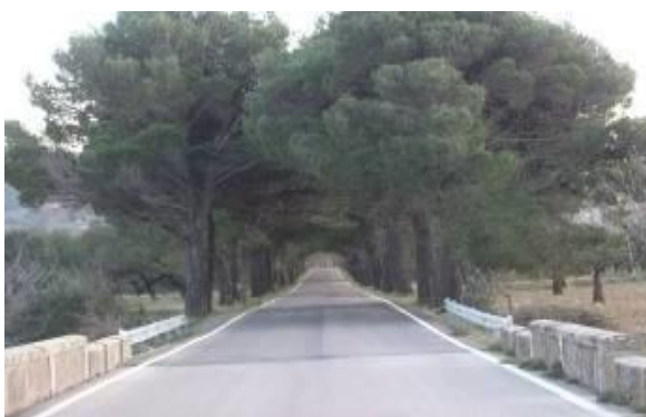
Une route tranquille (Thermes de L'avella)

Nombreux circuits vallonnés avec des distances variables, possibilité de monter à 1440m ou faire 120 km avec 400m de dénivelé. Nous vous proposerons des circuits de 50 à 140 km.