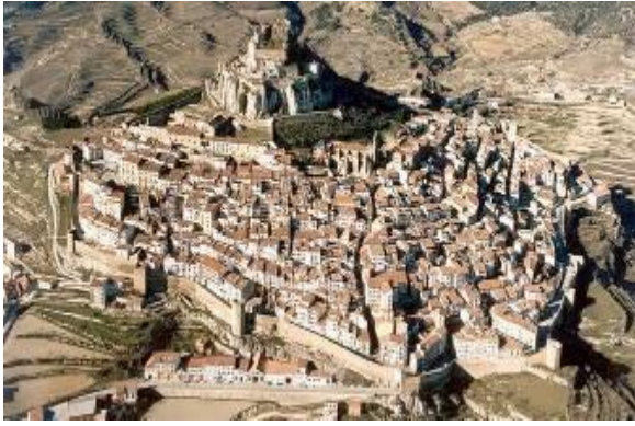
Morella, remparts, château et aqueduc (à 65 km)