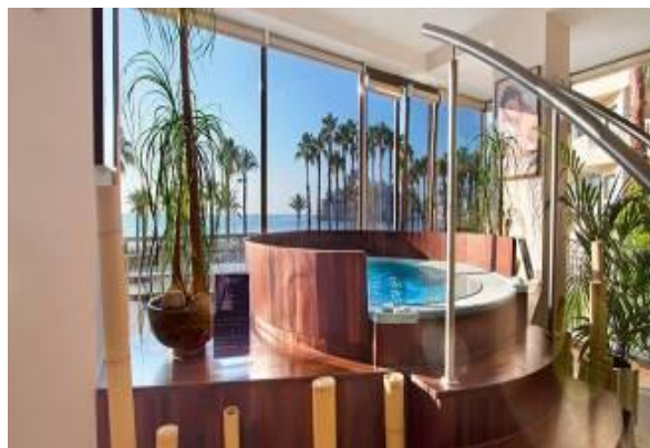
SPA, club gym, musculation et massages