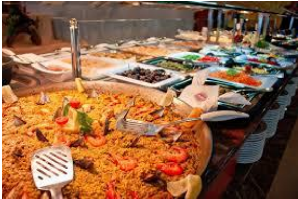
Une restauration de qualité