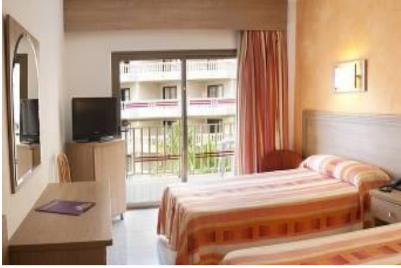
La chambre standard