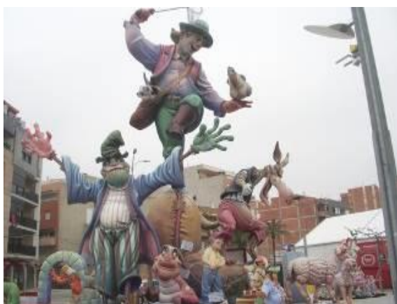
Animations et boutiques