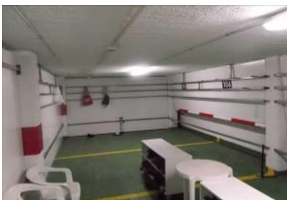
Un des 3 locaux à Vélo