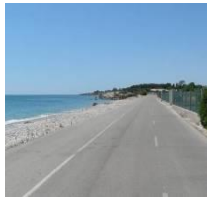
En bord de plage