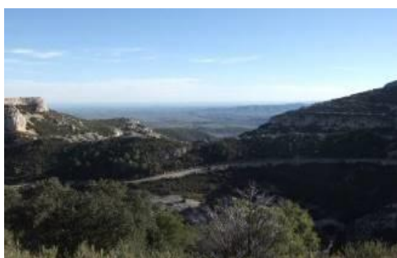
Accès à Bel (980m)