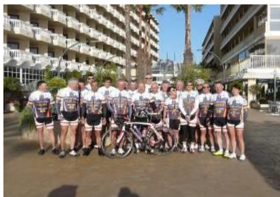
Les capitaines de route