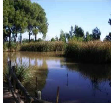
La réserve naturelle derrière l'hôtel

Toute reproduction est interdite sans notre accord.